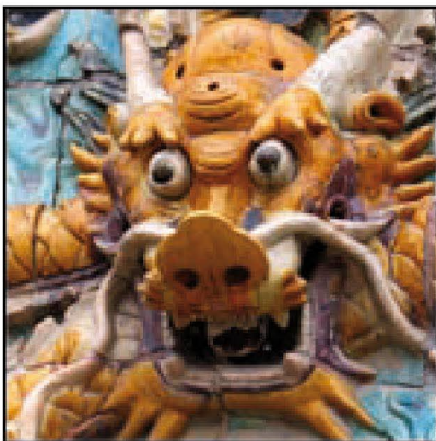
2,5 x 2,5 cm v rozlišení 150 dpi